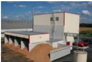
Chaufferie Biomasse Site Buchères