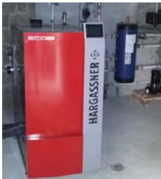
Les besoins en eau chaude sanitaire sont couverts par la chaudière de 50 kW et par des panneaux solaires thermiques.

Pour soutenir les projets de chaufferies bois, l'Agence d'Aménagement, d'Urbanisme et de l'Énergie de la Corse (AUE) et l'ADEME mettent en œuvre des programmes d'aides cofinancés par l'Europe (FEDER), le CPER et EDF. L'appel à projets « bois-énergie 2016 » a permis de sélectionner 2 projets de réseaux de chaleur bois à Corte et Fiumorbu (4 MW au total). L'appel à projets 2017 doté de 2 M€ de budget pourraient permettre de concrétiser des projets à Livia, Munaccia d'Audè, Sartè et Aleria. Un poste d'animateur bois-énergie a été mis en place au sein de la coopérative Silvacoop pour faire émerger d'autres projets entre 2017 et 2019.