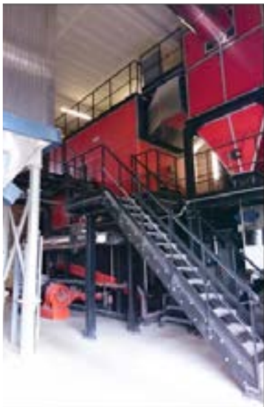
La chaufferie de Neufchâtel-en-Bray présente un taux de couverture biomasse de 90%.