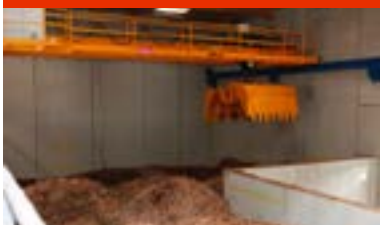
Le silo de 980 m 3 est équipé d'un grappin.

« Grâce aux réseaux de chaleur, comme celui de la Gauthière alimenté majoritairement par la biomasse, nous pouvons augmenter significativement la part des énergies renouvelables (EnR) sur notre territoire. Ce projet participe donc activement à l'atteinte de nos objectifs en termes de réduction de GES et de part d'EnR. Il permet également d'améliorer la qualité de l'air en remplaçant des solutions individuelles plus polluantes par une chaufferie biomasse centralisée et très réglementée. Nous sommes très attentifs à cet aspect de la qualité de l'air qui est très contrôlée. Des contrôles réglementaires ou inopinés sont régulièrement opérés et notre assistant au suivi de la DSP est très vigilant sur cette question. De plus, la Ville de Clermont-Ferrand a demandé à Atmo Auvergne de faire des mesures complémentaires dans un périmètre à proximité de la chaufferie pendant 6 ans autour de sa mise en service (avant et après). Ces mesures qui portaient notamment sur les HAP n'ont montré aucun impact de la chaufferie biomasse sur la qualité de l'air. »