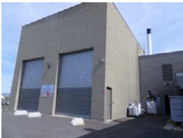
Quai de déchargement du bois

Pour un hôpital ou une collectivité, le principal intérêt d'un partenariat public privé (PPP) est de ne pas avoir à s'endetter au moment du financement de la construction, puisque celle-ci est à la charge du partenaire privé. De plus, ce type de contrat permet de n'avoir qu'un seul interlocuteur pendant toute la durée de la construction puis de l'exploitation. En contrepartie, les loyers à acquitter courent sur une longue période et peuvent au final avoir un impact néfaste sur le budget de la collectivité. De plus, les petites structures publiques n'ont pas toujours la compétence juridique pour évaluer les risques et les conséquences de la signature d'un tel partenariat.