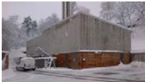
La chaufferie du centre hospitalier en plein hiver.

Elles ambitionnent de mobiliser à terme 80 000 à 90 000 m 3 de bois supplémentaires et de sécuriser l'approvisionnement des chaufferies en garantissant la hiérarchie des usages (bois d'œuvre, bois énergie, bois industrie).