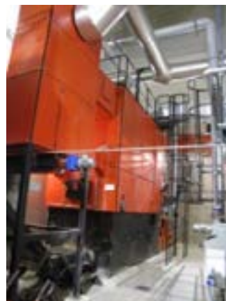
La chaudière bois Weiss de 2,4 MW

La région Grand Est possède sur son territoire deux centrales de cogénération au bois-énergie, à Epinal (Vosges) et Forbach (Moselle). Ces équipements qui consomment d'importants volumes de bois (150 000 t/an) ont contribué à structurer une filière régionale d'approvisionnement en bois qui bénéficie aussi aux plus petites chaufferies de collectivités, notamment celles situées en dehors des secteurs boisés comme Yutz.