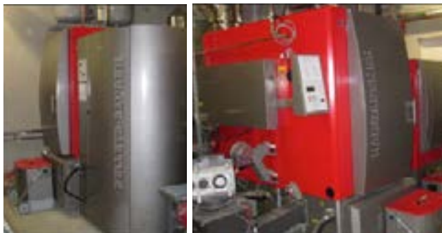
Chaudières 1 et 2

La chaufferie de l'ENAC est conçue pour fonctionner au granulé de bois l'hiver et au bois déchiqueté l'été. Ce choix permet de réduire le volume de stockage de combustible et donc le coût du génie civil. En effet, 1 m 2 stocke 660 kg de granulé contre seulement 150 à 200 kg de bois déchiqueté. Une chaufferie mixte granulés/bois déchiqueté peut donc constituer un bon compromis entre le montant de l'investissement, la facilité d'exploitation et le coût de l'énergie.