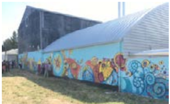
Fresque urbaine sur le mur de la chaufferie

La Direction Énergie s'appuie sur un bureau d'études spécialisé pour assurer le contrôle de la concession de façon à garder un regard critique sur les performances de l'installation.