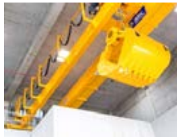
Le grappin du silo semi-enterré