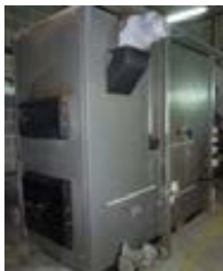
La chaudière Fröling de 500 kW fonctionne près de 6 000 h/an.

Dès sa naissance en 2000, le Pays de Haute Mayenne a travaillé sur l'efficacité énergétique et le développement des énergies renouvelables. Pour le bois-énergie, le Pays a d'abord mis en place, avec l'aide de l'ADEME Pays de la Loire, une animation afin d'installer un premier parc de chaufferies à bois déchiqueté. Puis le Pays a souhaité créer une filière d'approvisionnement local. Plusieurs études ont été réalisées pour vérifier la faisabilité technique, économique et juridique d'une telle structure. La SCIC Haute Mayenne Bois Energie (aujourd'hui SCIC Mayenne Bois Energie) a été créée en 2008. Depuis, les élus accompagnés du Relais Bois Energie, poursuivent le travail d'animation pour faire émerger de nouvelles chaufferies.