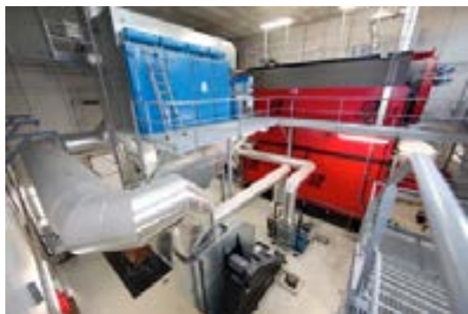
La chaufferie bois de 7,7 MW du quartier de La Gauthière

La densification ou l'extension du réseau de chaleur en dehors du périmètre délégué est une solution intéressante pour améliorer son équilibre financier. La réalisation d'un schéma directeur du réseau recense les souhaits de raccordements des bailleurs sociaux, industriels ou autres acteurs privés proches. Cette opportunité leur permet de réduire le montant de leur Contribution Climat Energie et d'alléger leurs contraintes réglementaires en sous-traitant une partie de la production d'énergie. Un travail de pédagogie est cependant nécessaire pour expliquer le fonctionnement contractuel, technique et financier du réseau.