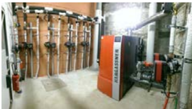
La chaudière consomme environ 50 t/an de plaquettes forestières.

Pour soutenir les projets de chaufferies bois, l'Agence de l'Urbanisme et de l'Énergie de la Corse (AUE) et l'ADEME mettent en œuvre des programmes d'aides cofinancés par l'Europe (FEDER), le CPER et EDF. L'appel à projets « bois-énergie 2016 » a permis de sélectionner 2 projets de réseaux de chaleur bois à Corte et Fiumorbu (4 MW au total). L'appel à projets 2017 doté de 2 M€ de budget pourrait permettre de concrétiser des projets à Livia, Munaccia d'Audè, Sartè et Aleria. Un poste d'animateur bois-énergie a été mis en place au sein de la coopérative Silvacoop pour faire émerger d'autres projets entre 2017 et 2019.