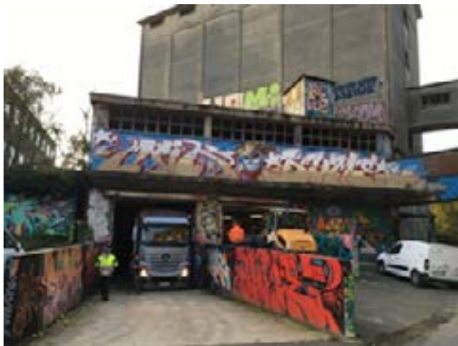
L'ancienne malterie qui abrite la chaufferie témoigne du passé industriel du quartier.

L'équilibre économique d'un réseau de chaleur dans un écoquartier peut être complexe car les besoins des bâtiments sont faibles. Ainsi, l'optimisation énergétique du réseau de chaleur est indispensable (température de départ la plus basse possible, épuisement maximal des températures retour...). De plus, la construction du réseau démarre souvent sans souscription de raccordement par les abonnés. La sécurisation du modèle peut passer par la contractualisation des ventes en amont et par une renégociation si les engagements ne sont pas confirmés.