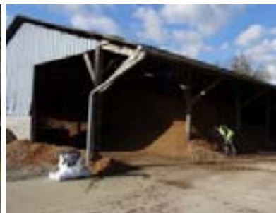
La plateforme de la SCIC à Gorron