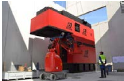
Mise en place de la chaudière bois de 3,3 MW

Dans le cadre de la nouvelle délégation de service public, le réseau de chaleur fonctionne désormais en eau chaude et plus en eau surchauffée (température inférieure à 105°C) afin de diminuer les pertes thermiques. Une chaudière biomasse de 3,3 MW couvre plus de 60% des besoins.