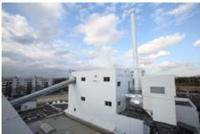
La chaufferie de Fort de l'Est à Saint-Denis

Le réseau délivre un total de 350 GWh/an et des extensions à hauteur de 75 GWh/an sont envisagées. Il mesure 60 km et dessert 400 sous-stations et 40 000 équivalents-logements.