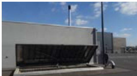
Chaufferie de Sceneo

Le choix du partenariat public privé pour la réalisation de ces bâtiments à forte consommation permet de limiter au maximum les risques de dérives énergétique pour la collectivité tout au long du contrat. L'exploitant de la chaufferie s'engage en effet à la fois sur le mixte énergétique et sur la consommation des bâtiments sur la base de certains ratios liés à la dureté de l'hiver et à la fréquentation. Cet engagement n'est possible qu'en raison de son implication lors de la conception et de la construction des équipements par le maître d'ouvrage. Il assure ainsi selon les étapes un rôle de conseil et de contrôle qui lui permet de s'engager durablement.