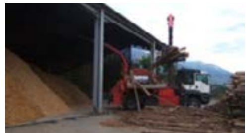
La plate-forme de bois décheté de la Communauté de communes de Serre-Ponçon

Pour poursuivre son action en faveur de la structuration de la filière bois énergie, la Communauté de Communes de Serre Ponçon est partenaire des projets MOB+ et Bois+05 dans le cadre de l'appel à manifestation d'intérêt DYNAMIC Bois de l'Ademe de 2015 puis 2016.