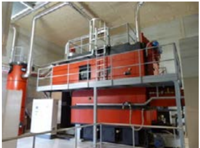
Chaudière Compte-R de 2 MW

Depuis dix ans, le Siel 42 a financé 46 chaufferies bois alimentant des réseaux de chaleur ou des bâtiments dédiés. Elles représentent un total de 9,1 MW installés (fin 2016) et une consommation de 9000 t/an de bois. Le Syded s'est intéressé aux réseaux de chaleur bois dès 2005. Il a construit ses deux premiers réseaux en 2007 puis en a installé en moyenne deux par an jusqu'en 2015. L'ensemble des chaufferies bois totalise une puissance installée de 15 MW pour une consommation de 15000 tonnes de bois par an.