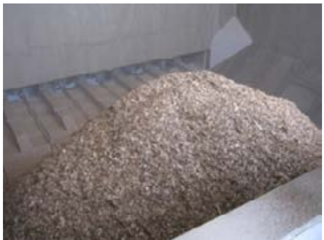
La chaudière brûle exclusivement des plaquettes forestières.

Une collectivité qui souhaite convertir son réseau aux énergies renouvelables ou de récupération étudie en priorité la valorisation de la chaleur de l'incinérateur. Si ce dernier est trop éloigné du réseau et qu'il n'y a pas de potentiel géothermique sur la commune, le bois-énergie est la solution. La technologie des chaudières collectives à bois déchiqueté est désormais maîtrisée et les filières d'approvisionnement sont constituées. Les collectivités bénéficient par ailleurs des aides du Fonds chaleur de l'ADEME qui rendent compétitive cette solution par rapport aux énergies fossiles.