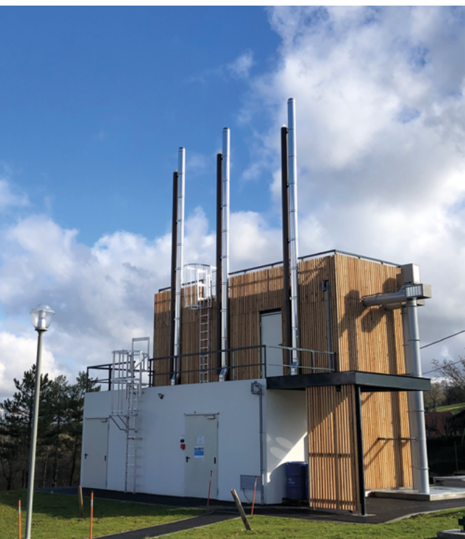
Chaudière bois EHPAD de Mamirole (Doubs)