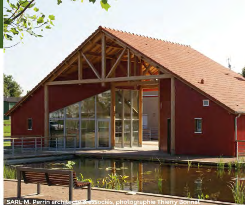
SARL M. Perrin architecte & associés, photographie Thierry Bonnat