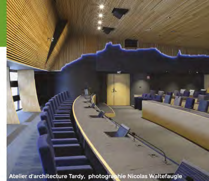
Atelier d'architecture Tardy

Réhabiliter un équipement (rénovation / réhabilitation / extension-surélévation d'un bâtiment)