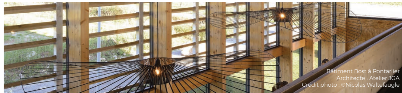
Bâtiment Bost à Pontarlier Architecte : Atelier JGA